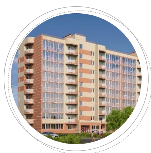
г. Ярославль ул. Летная, л. 5

Застройщик: ООО «Славянский Дом» Проектировщик: ООО «СлавПроект»