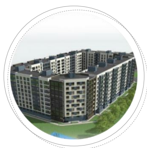
г. Иваново ул. Куконковых

Застройщик: ООО «Славянский Дом» Проектировщик: ООО «СлавПроект»