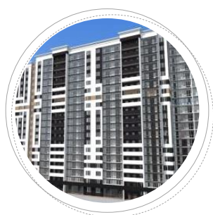
г. Иваново ул. Профсоюзная, д. 4, л. 1

Кол-во квартир: 495 Тип: мон. + кер. кирпич Кол-во этажей: 18, 19