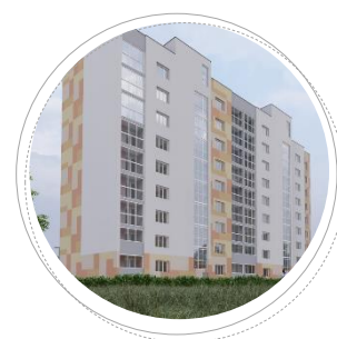
г. Иваново ул. Отдельная л.1

Застройщик: ООО «Славянский Дом» Проектировщик: ООО «СлавПроект»